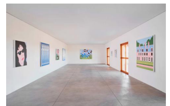
Abb. 1: John Wesley Gallery, Chinati Foundation, Marfa, Texas.