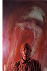
Gottfried Helnwein, „Mund der Selbste“ 1981