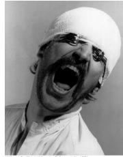
Abb. 1: Gottfried Helnwein, Selbstporträt, 1981