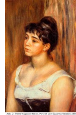
Abb. 2: Pierre-Auguste Renoir, Porträt von Suzanne Valadon, 1889